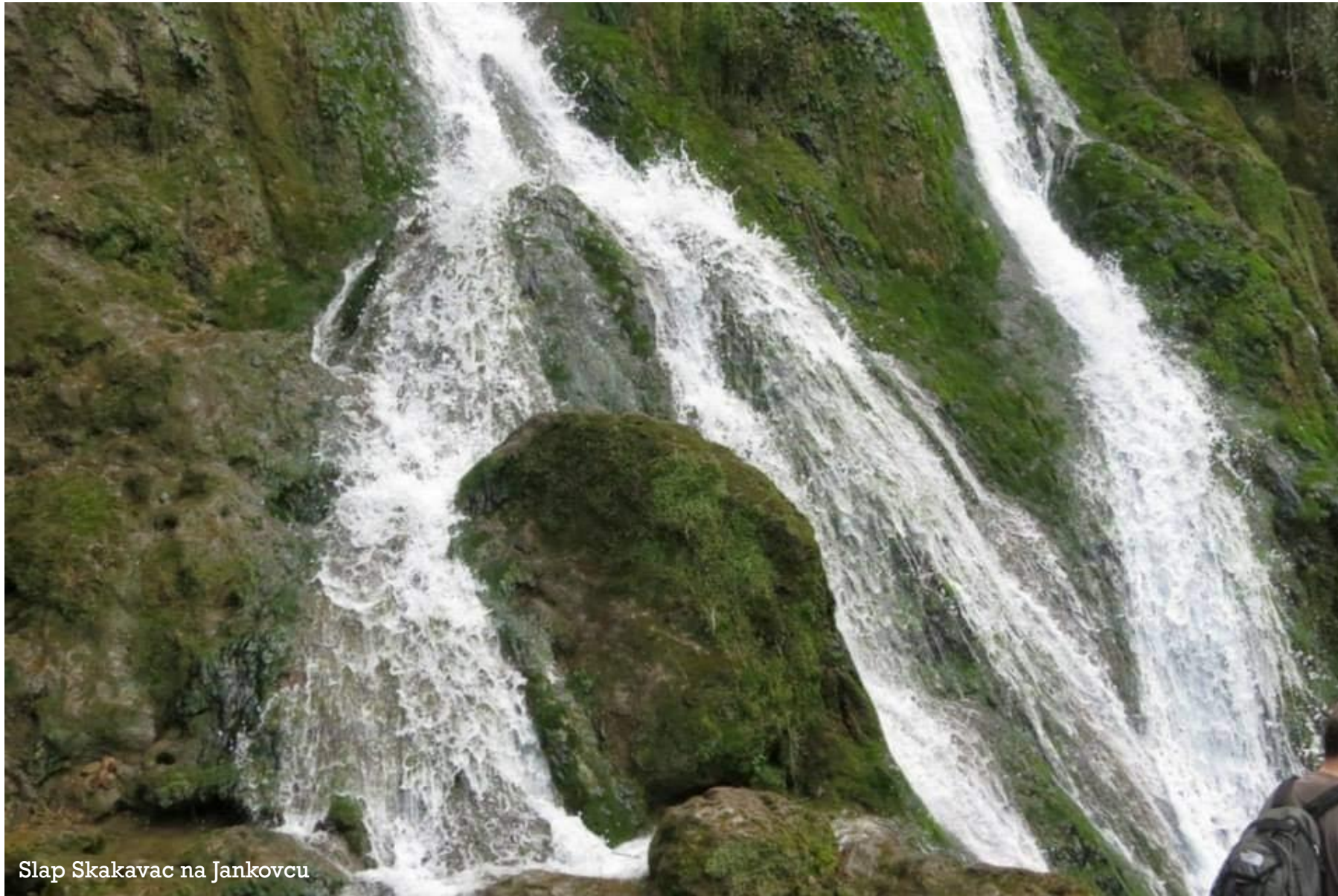
Slap Skakavac na Jankovcu

Odvojimo korisni otpad iz miješanog komunalnog otpada i dajmo svoj doprinos zaštiti okoliša!